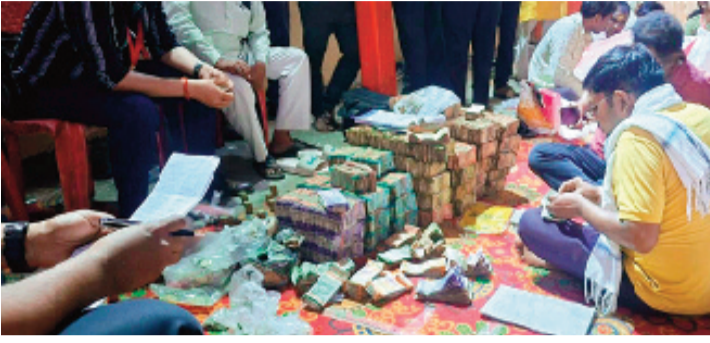
हरिभूमि न्यूज अशोकनगर

तीन दिन तक चले रंग पंचमी करीला मेले में आई चढ़ोत्तरी की गिनती सोमवार को हुई है। गिनती करने में 80 पटवारी, इतने ही चौकीदार और नायब तहसीलदार रैंक के चार अधिकारी मौजूद रहे। सुबह दस बजे से शुरू हुई गिनती शाम 6 बजे तक पूरी हुई। गिनती में कुल 20 लाख 760 रुपए नगद सामने आए हैं, जो नारियल प्रसाद के रूप में चढ़ाए गए थे, उन्हें 2 लाख 1 हजार रूपए में नीलाम किया गया है। सके अलावा माता जानकी के नाम एक चेक 40 हजार रूपए का भी दान पेटियों से निकला है। इस बार दानदाताओं ने अमेरिका, भूटान, नेपाल, थाईलैंड की करंसी भी दान की है। एक दानदाता ने गुजरात स्थित जूनागढ़ का रियासत कालीन चांदी का सिक्का भी दान किया है।