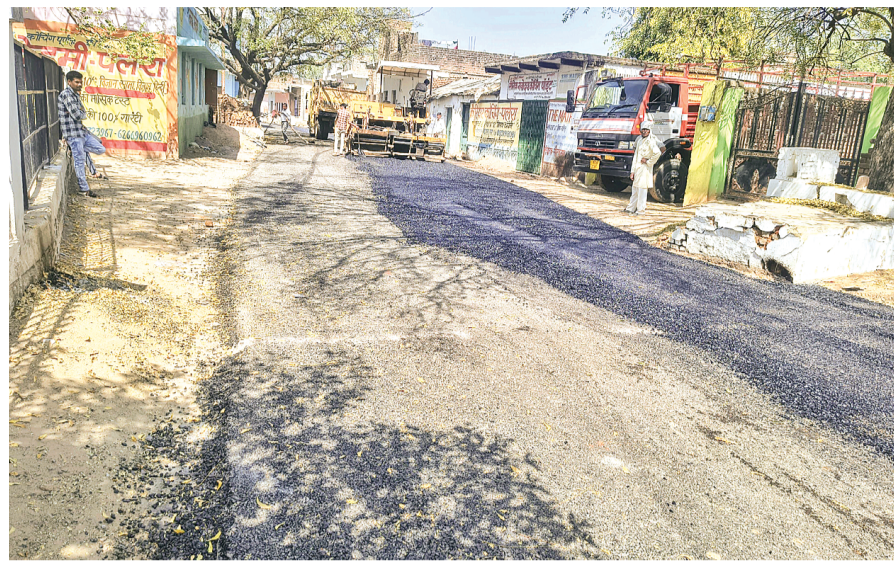
हरिभूमि न्यूज | पलेरा

डामरीकरण से चमक रही तीव्र गति से पलेरा की सड़कें, वर्षों की समस्या से राहत