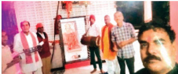
हरिभूमि न्यूज शाढ़ौरा

स्थानीय हनुमान मंदिर बस स्टैंड से 2010 से लगातार आज तक हर रोज सुबह चार बजे से प्रभात फेरी निकाली जा रही है। राम धुन गाते हुए गाजे-बाजे के साथ प्रभात फेरी पूरे नगर का भ्रमण करते हुए सुबह के समय भगवान की आराधना करते हुए शुभ संदेश एव मन की शांति के लिए सुबह लोग प्रभात फेरी में शामिल होकर रोजाना अच्छे व शुभ दिन की शुरुआत करते हैं।