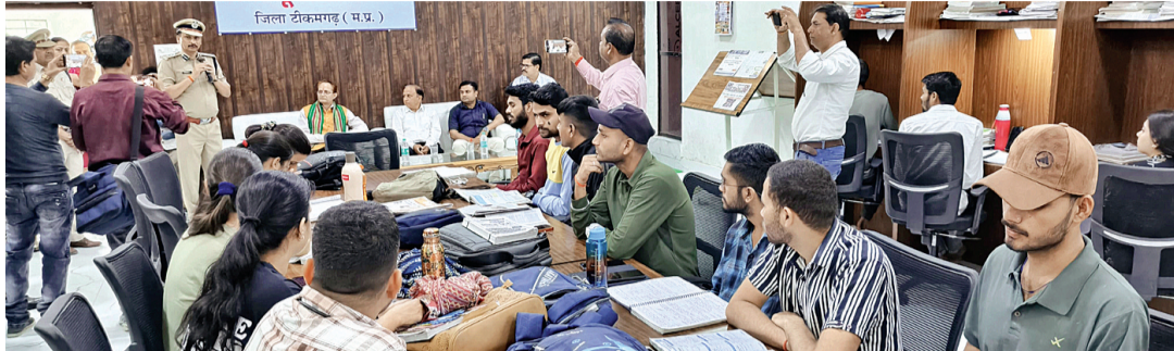
जिला टीकमगढ़ ( म.प्र. )